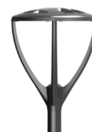
3. Luminaire LED