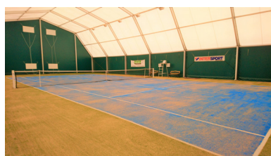
1. Court de tennis en gazon synthétique